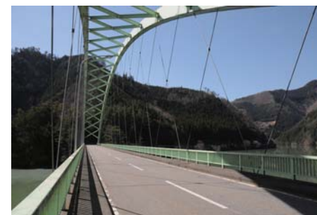
綺麗なアーチを描く