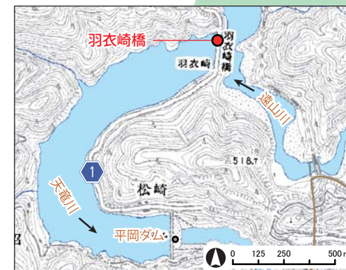
(国土地理院の数値地図25000(地図画像)を使用)