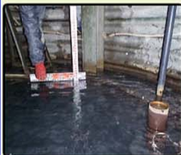
内部堆積土砂除去後