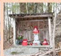
国道152号の脇に安置されている地藏峠