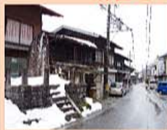
飯田市上村上町にある「秋葉・翠平」の碑