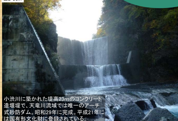
わざさばうえんてい 上蔵砂防堰堤

小渋川に築かれた堤高23mのコンクリート造堰堤で、天竜川流域では唯一のアーチ式砂防ダム。昭和29年に完成。平成21年には国有有形文化財に登録されている。