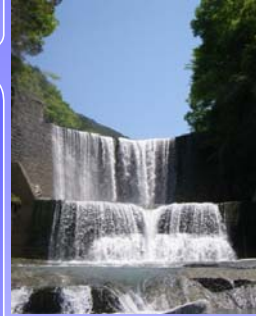
上蔵砂防堰堤 (大鹿村大河原)