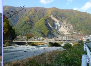
小渋橋・大西山崩壊地 (大鹿村大河原)