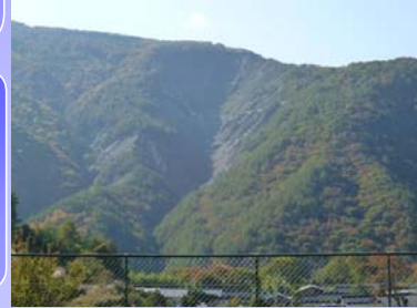
鶯ヶ巣大崩壊地 (大鹿村大河原)