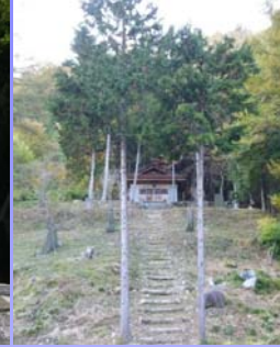
四徳集落跡 (中川村四徳)