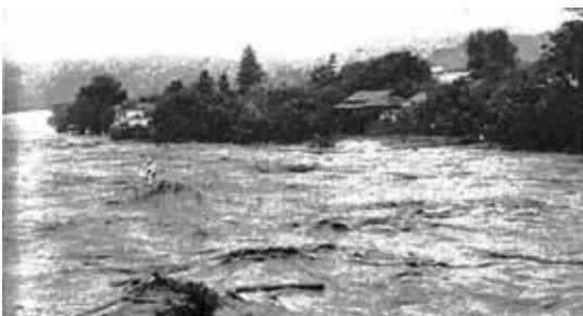
6月28日 午前7時頃 の時又付近 の天竜川