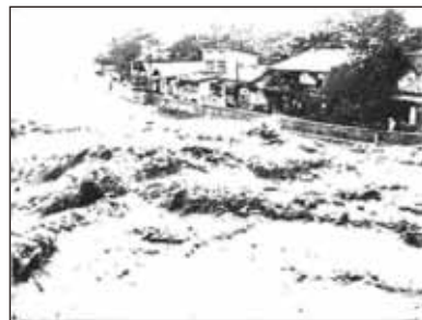
6月27日 午後6時頃 の時又付近 の天竜川