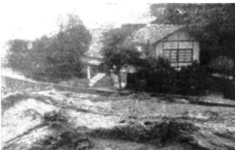
6月27日 午後5時頃 の時又付近 の天竜川