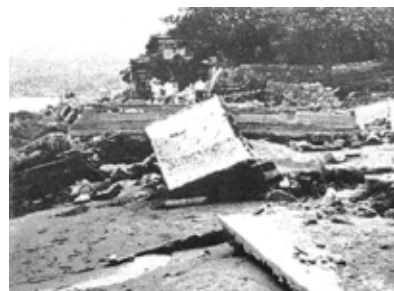
6月30日 午後の時又 付近の天竜川