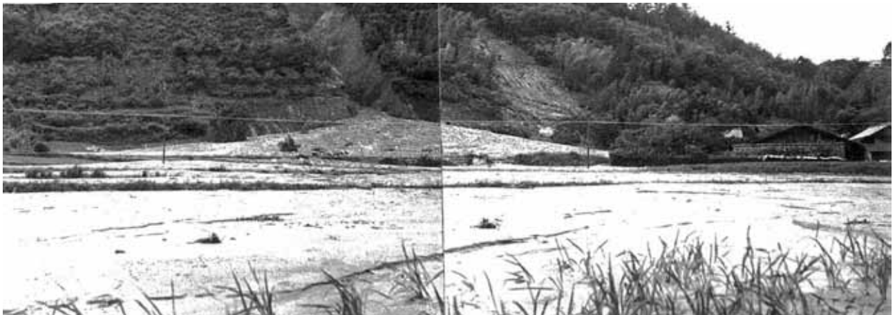
南小学校東側の山腹の崩壊で埋没した下市田羽根地籍の水田