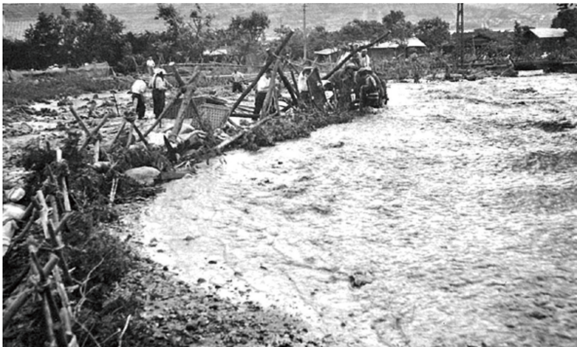
飯田線の西側での水防作業