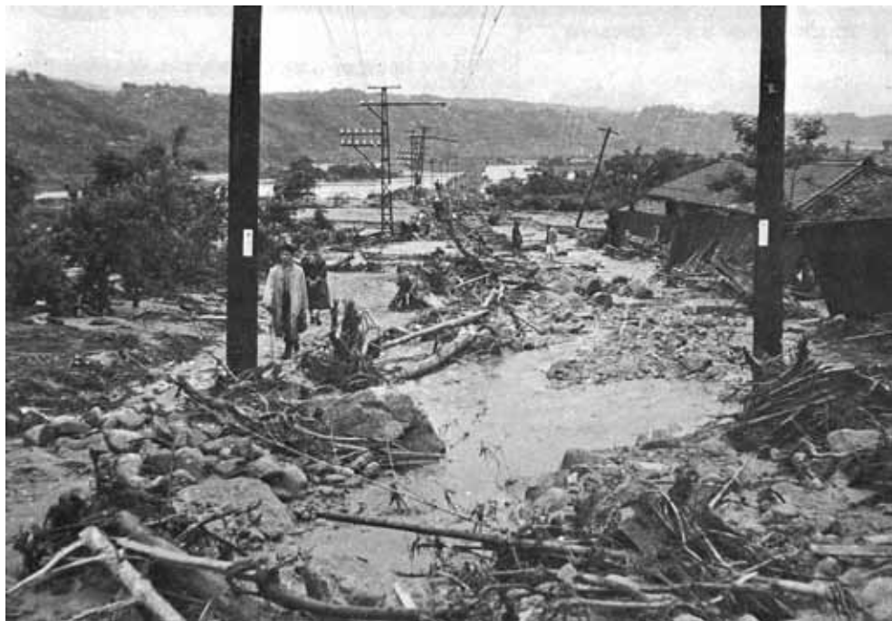
市田駅と大島川間の飯田線