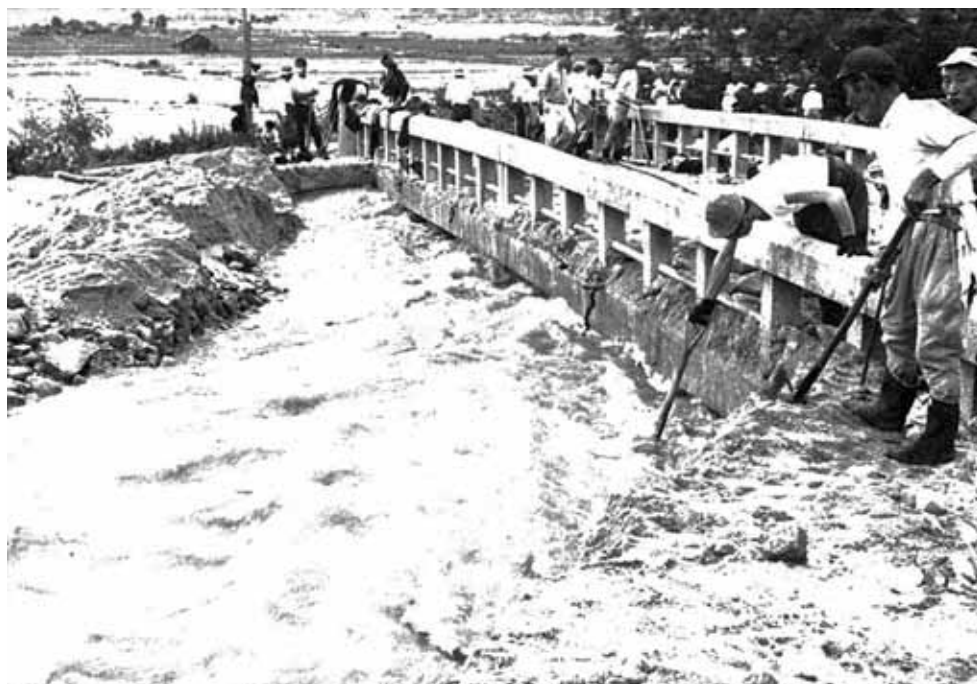
飯田線東側の大島川にかかるみずほ橋