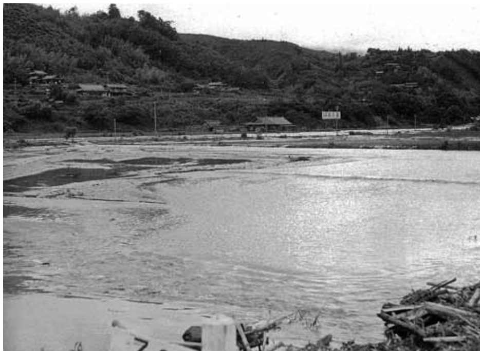
天竜川胡麻目川の大氾濫。山吹下平付近の惨状