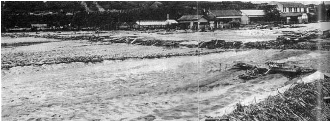
流失した下市田河原。奥の建物は農業試験場