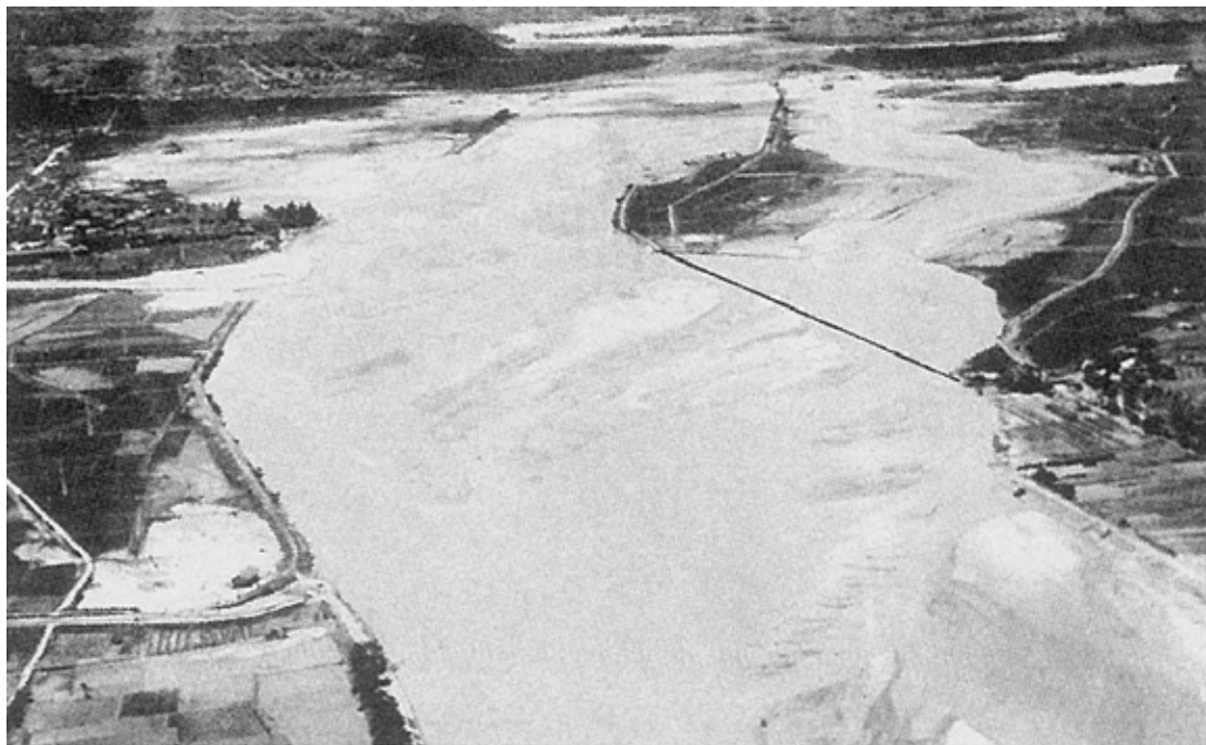
明神橋上空から天竜川の下流をみる。右手が下市田河原