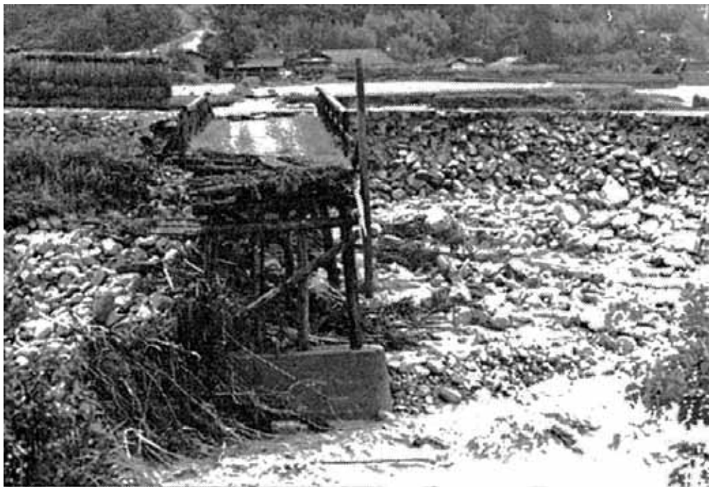
決壊した前沢川護岸とさがりり橋。