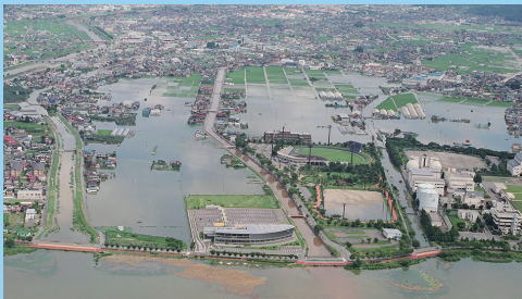
諏訪市豊田：浸水状況