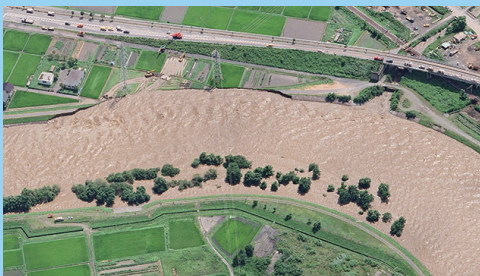
箕輪町北島：堤防決壊