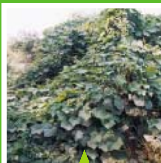
アレチウリ 最盛期:8~9月