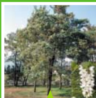
ニセアカシア(ハリエンジュ) (右下は花の拡大) 花の時期:5月中旬