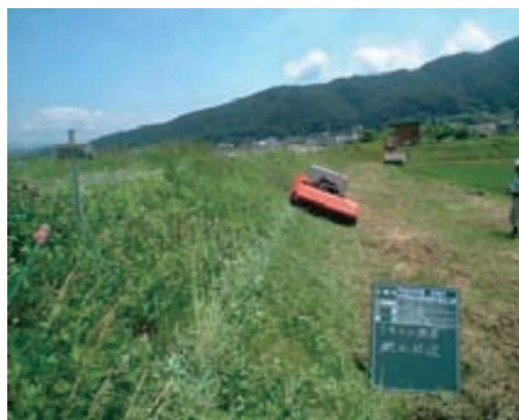
ラジコン草刈機による除草