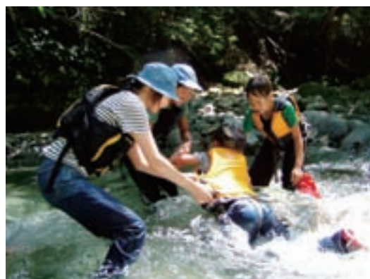
「川に親しみながらの防災講座」