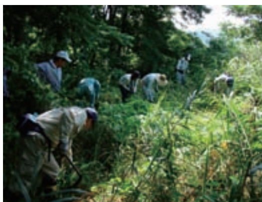
「アレチウリ駆除大作戦」