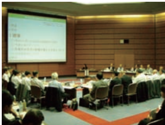
天竜川流域委員会

天竜川の今後概ね30年間での具体的な川づくりを定める「天竜川水系河川整備計画」の策定に向けて、昨年度まで「天竜川流域委員会」「河川懇談会」などを開催し、各方面からの意見をいただき、とりまとめたところ、引き続き早期策定に向けて関係機関との調整をはかり推進する。