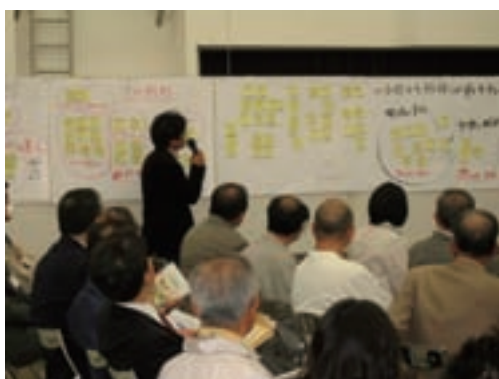
「天竜川ゆめ会議との座談会」

河川愛護やアレチウリ駆除、ハリエンジュ伐採などの天竜川に関する住民活動と協働する。NPO法人 天竜川ゆめ会議、三峰川みらい会議が実施する地域交流、座談会などを支援する。