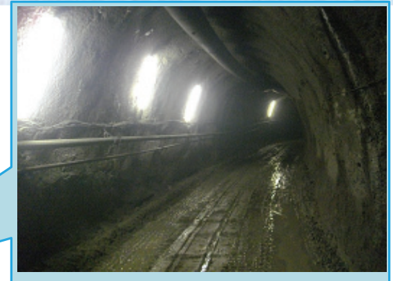
トンネル入口 川の流れはここからトンネルに入ります