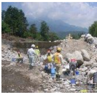
現場内の魚の救出作業の様子