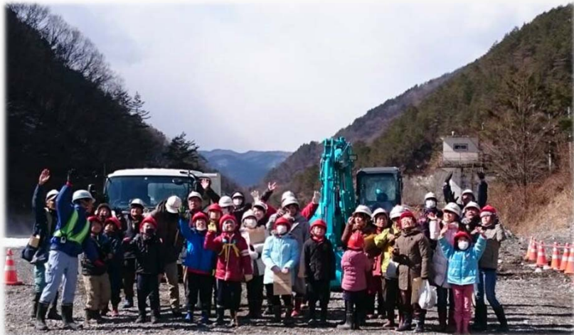
最後に、ドローンのカメラに手を振って～

年度末に向けて各工事ラストスパートですが、安全に留意し進めます。何卒、ご協力よろしくお願いたします。