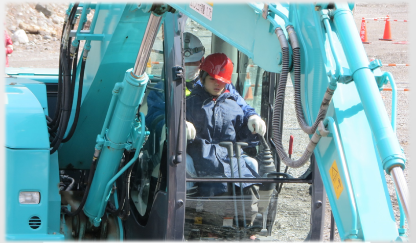
上手に土をすくえるかな～??