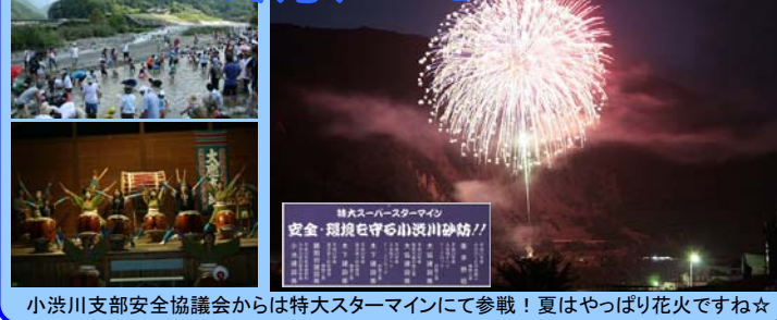
小渋川支部安全協議会からは特大スターマインにて参戦！夏はやっぱり花火ですね☆