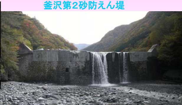
釜沢第2砂防えん堤