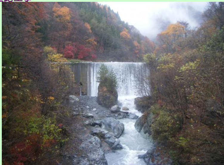
小河内砂防えん堤