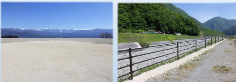
関谷原堤埋立て完了