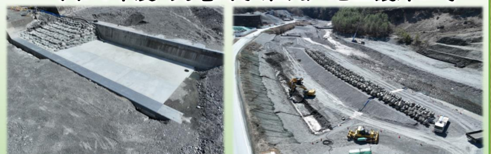
下流工区 床固め補修完了