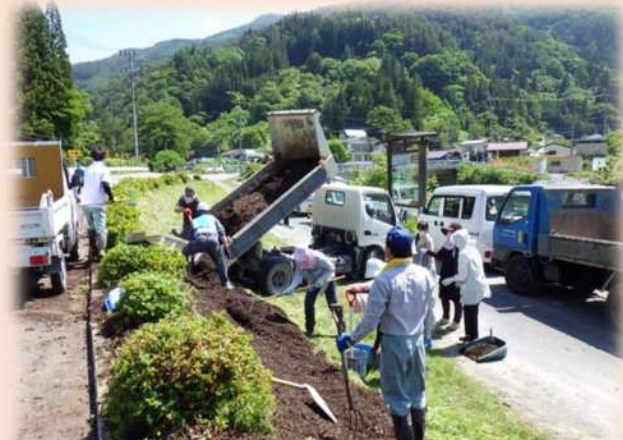
国道152号道路脇の花壇整備のお手伝いをさせていただきました。