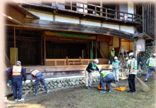
3年ぶりに有観客で開催された大鹿歌舞伎秋の公演会場準備清掃等に協力させていただきました。