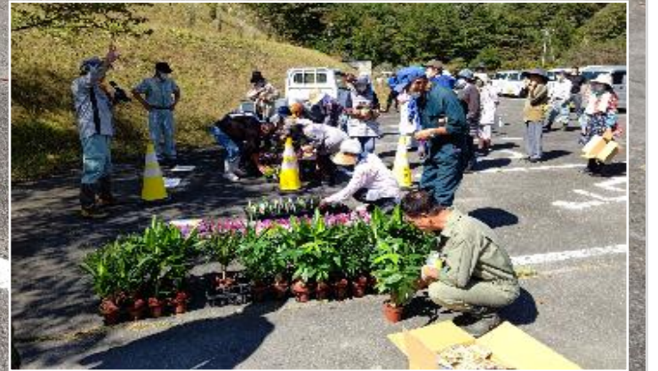
作業終了後、作業の慰労と日頃からの美しい村活動への感謝として花苗等の配布が行われました。