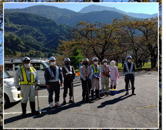
小渋川支部安全協議会のメンバーも参加しました！

連合設立時から加盟している大鹿村では10月2日（日）をビューティフルデイとし、村の資源である大西公園の桜の手入れ作業をおよそ60人の住民で実施し、2時間程度で約200本の桜に施肥を行いました。小渋川支部安全協議会でも作業に参加させてもらい、住民の皆さんと一緒に桜の手入れを行いました。