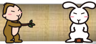
一幕目「青砥稿花紅彩画 稲瀬川勢揃の段」