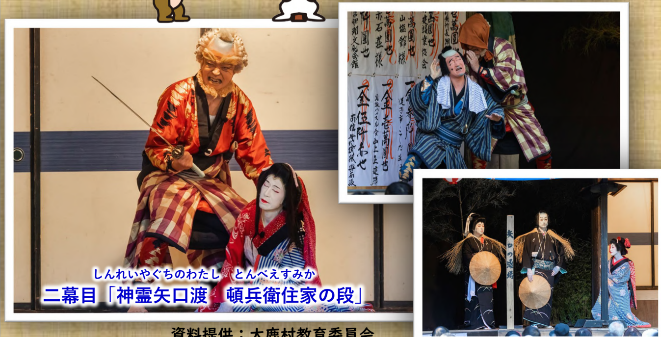
しんれいやぐちのわたし とんべえすみか