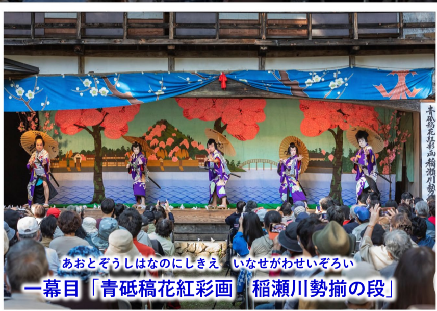
あおとぞうしはなのにしきえ いなせがわせいぞろい