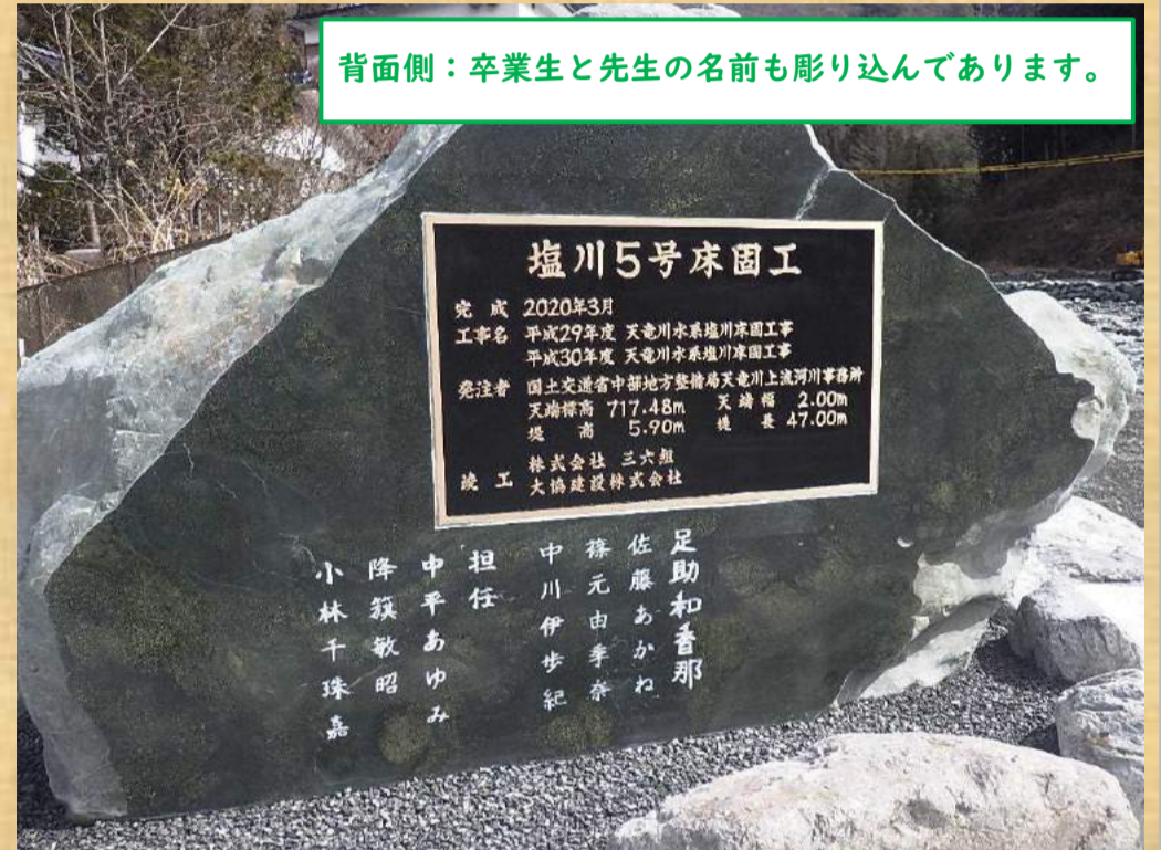
背面側：卒業生と先生の名前も彫り込んであります。

昨年度は新型コロナウイルスの流行し始めた影響で残念ながら、お披露目式を行うことができませんでした。