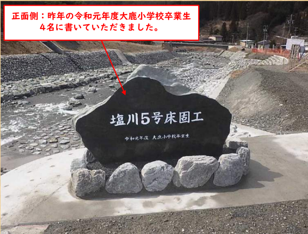
正面側：昨年の令和元年度大鹿小学校卒業生4名に書いていただきました。