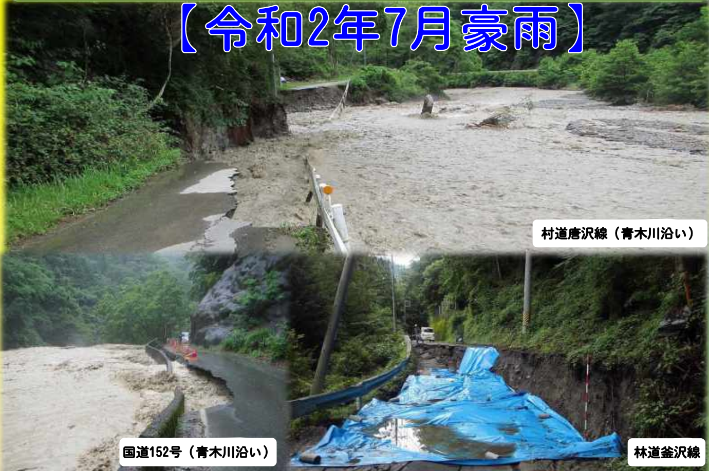
村道唐沢線（青木川沿い）