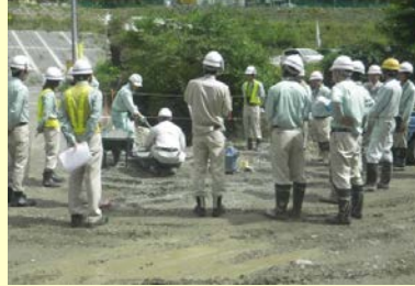
品質管理試験の見学