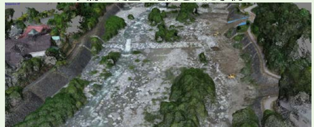
ドローン写真測量により作成した三次元モデル