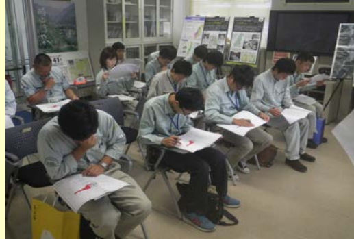
集中して座学に取り組んでいます。

小渋川砂防出張所にて「砂防」の目的や重要性等を学んだ後、施工中の工事現場において生コンクリートの品質管理であるスランプ試験、空気量測定、単位水量測定の試験状況や実際のコンクリートの打設状況を見学しました。また、コンクリートの圧縮強度試験に用いる供試体の作成体験を行いました。