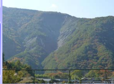
鷹ヶ巣大崩壊地 (大鹿村大河原)