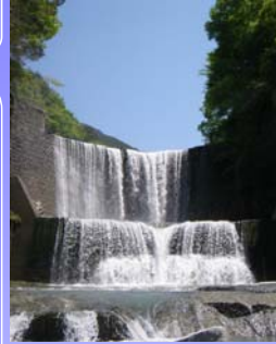
上蔵砂防堰堤 (大鹿村大河原)