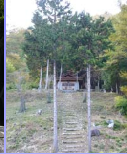
四徳集落跡 (中川村四徳)