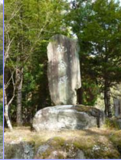
北川集落跡 (大鹿村鹿塩)