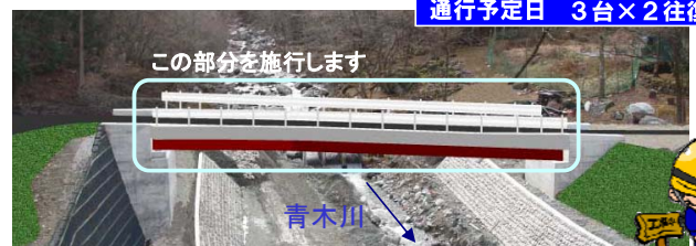
青木川 完成予想図