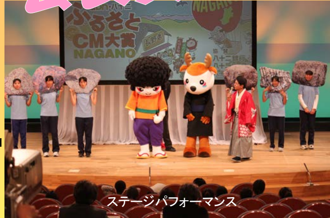
ステージパフォーマンス