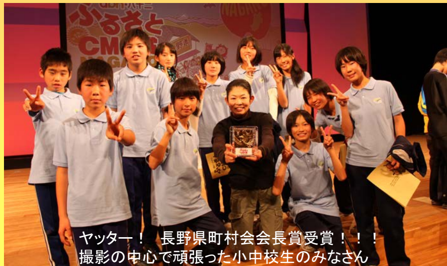
ヤッター! 長野県町村会会長賞受賞!!! 撮影の中心で頑張った小中校生のみなさん

『ふるさとCM大賞』・・・ん?どこかで聞いたことがあるゾ!という方もいらっしゃるでしょう。毎年長野朝日放送(abn)で開催しているふるさとへの想いを込めた手作りCMを競い合う祭典です。今回で12回目を迎えるこの企画ですが、今年は県内の54市町村から91作品が寄せられました。この中で大賞を含めた賞を受賞できるのはわずかに13作品のみ。非常に狭き門ではありますが、今回大鹿村が出品した『 鉄道ではありません(中央構造線) 』が見事、 長野県町村会会長賞(優秀5作品の1つ) を受賞されました。