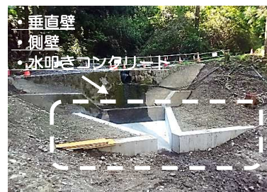
垂直壁 側壁 水叩きコンクリート