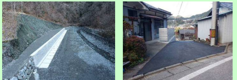
北又沢第2砂防堰堤管理用道路補