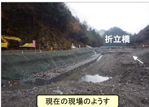
現在の現場のようす

明けましておめでとうございます。本年もよろしくお祈りいたします。 昨年は自然の猛威に現場が翻弄された年でした。6月末の梅雨前線豪雨では、遠山川の水位が上昇し仮締切が一部流されてしまい、10月の台風19号では現場が全部水没し多量の土砂で埋まってしまい、復旧するのに1ヶ月以上かかってしまいました。 今年は昨年のように雨がたくさん降らないことを祈っています。