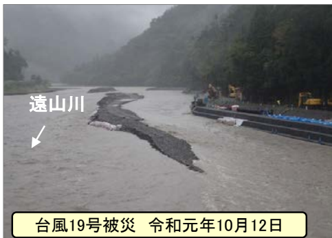
台風19号被災 令和元年10月12日