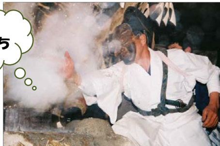
12月13日 和田諏訪神社

明けましておめでとうございます。本年もよろしくお祈りいたします。 「遠山の霜月祭り」が各神社で行われました。旧暦の霜月に全国の神々を迎え、湯の周りを舞う「湯立て神楽」を奉納し無病息災を祈りました。 整備工事も、順調に進んでいます。無事故・無災害で完成の日を迎えたいと思います。各地域の皆様にはご迷惑おかけしますが、ご理解と御協力をお願いします。