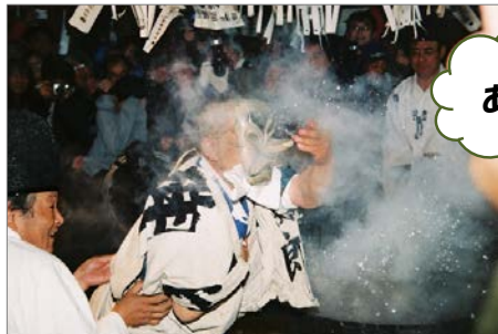
12月14日 木沢正八幡神社