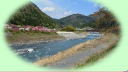
和田大橋から望む遠山川

今月のカモシカ通信は、この3月で無事、完成しました工事につきまして、現場から、地域の皆様へのご挨拶と、完成の報告につきまして、ご紹介します。