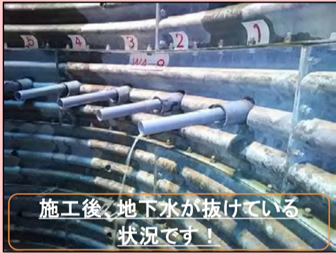
施工後、地下水が抜けている状況です！