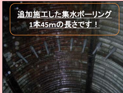
追加施工した集水ボーリング 1本45mの長さです！