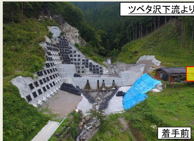
ツベタ沢下流より上流を望む