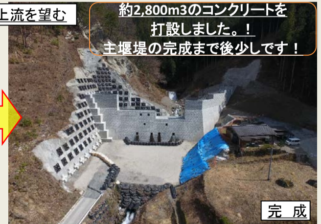
約2,800m 3 のコンクリートを打設しました。！主堰堤の完成まで後少しです！