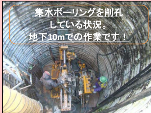
集水ボーリングを削孔している状況。地下10mでの作業です！