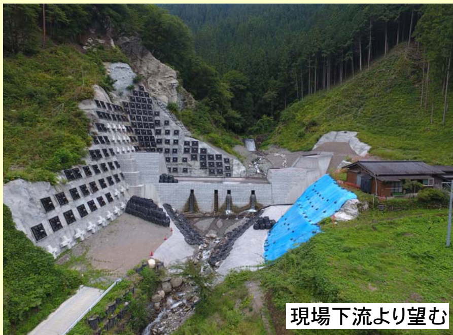
現場下流より望む