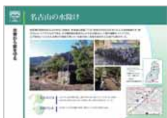
説明資料(名古屋の水除け)