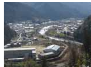
夜川瀬地区の氾濫