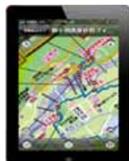
デジタルガイドマップ