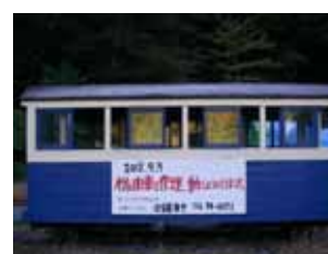
遠山の森林鉄道 梨元貯木場