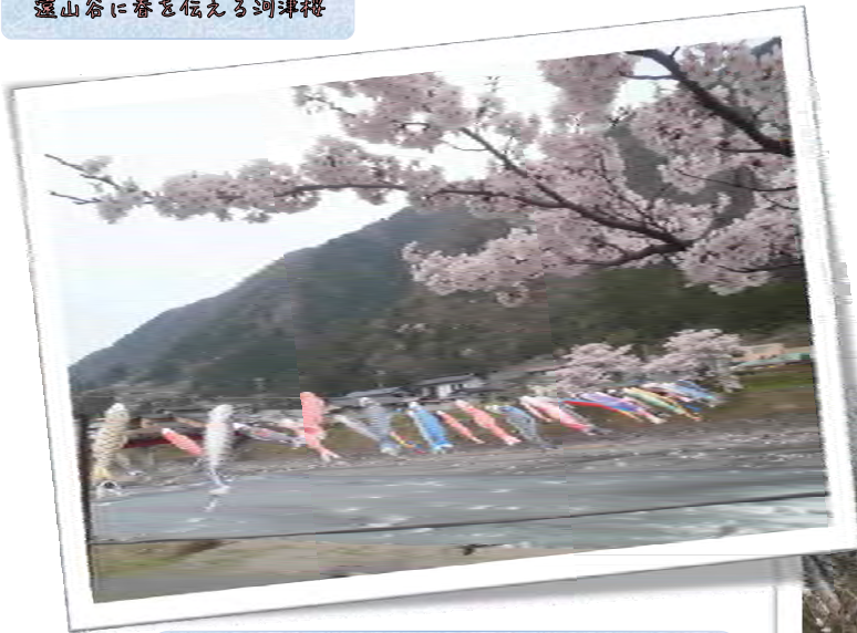
遠山川治いの桜が咲き、 沢山の鯉のぼりが泳いでいます。