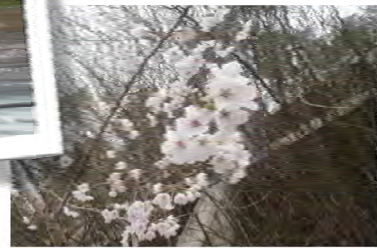
工事用道路の種樹した桜も咲きました