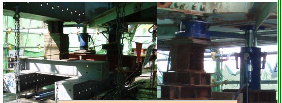
100tジャッキ(1箇所当たり2個使用)

支間長46mの間に仮設ベントを4基設置し、そのベント上で油圧ジャッキにより主桁(橋全体)をジャッキアップ(真ん中で約17cm持ち上げる)して、既設主桁の補強を行い、既設主桁(入口部約9.2m)を撤去、新設主桁を再設置します。主桁設置替えが終了後、ジャッキダウンして既設縦桁の補強及び新設縦桁の設置等を行います。