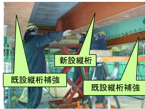
既設縦桁補強 新設縦桁(センター)設置