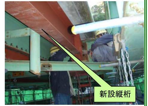
新設縦桁(両サイド)設置