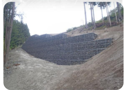
工事用道路・大型カゴ枠

写真だけを見ればよく見かける集水樹ですが、蓋を開ければ1箇所40mのパイプが1箇所設置されています。このパイプを通じて地中にある地下水を排除する仕組みになっているのです。(箇所数は違いますが、あと2箇所施工しました。)