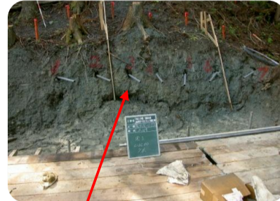
このパイプを通じて下の集水樹へ地下水を排出します

本工事は10月31日を持ちまして全作業終了いたしました。 この工事は、此田地区の地すべりを防止する為の地下水を排除する工事です。