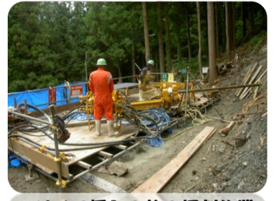
パイプ挿入の為の掘削作業