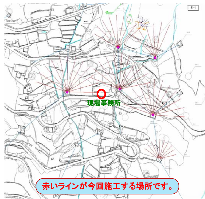
赤いラインが今回施工する場所です。