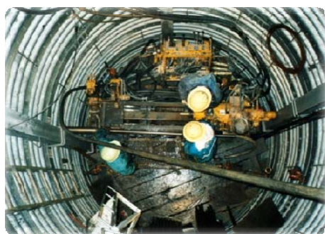
<施工中のイメージ>

今工事で行うボーリングの最長の長さは、和田大橋の三分の二以上の長さに相当します。