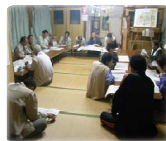
<地元説明会の状況>

工事に先立ち、地元此田地区の皆様を対象に工事の説明会を行いました。工事内容及び工事工程の説明、通行規制のお願いを行いました。現地の状況などに、地元住民ならではの意見を頂き、大変参考になりました。