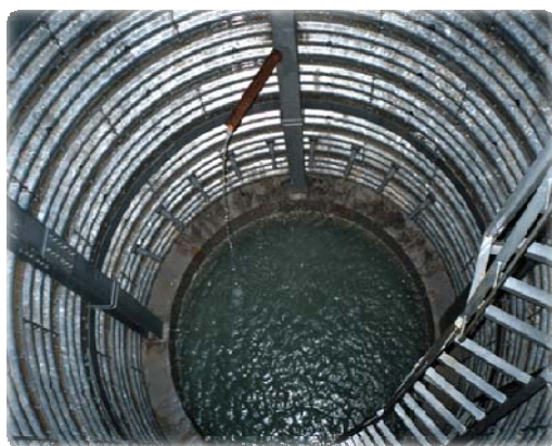
<完成予想イメージ>

発注者 国土交通省 天竜川上流河川事務所 遠山川砂防出張所 工期 自 平成22年 9月29日 至 平成23年 3月15日 工事概要 地下水排除工 追加集水ボーリング工 6カ所