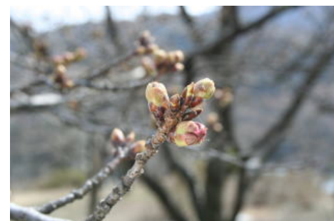
大西山の桜の開花状況(3月31日現在)

昨年、7月から法面の崩落により全面通行止であった市道上村4号線ですが、復旧工事により4月10日午後5時に通行可能となる予定です。これにより、飯田市上村と下伊那郡大鹿村とが通行可能になります。桜の咲くこの季節、国道152号線地蔵峠を抜けて桜で有名な大鹿村にお出かけしてはいかがでしょうか。なお、大鹿村の桜の開花予報は4月7日頃、満開は4月12日頃の予報です。