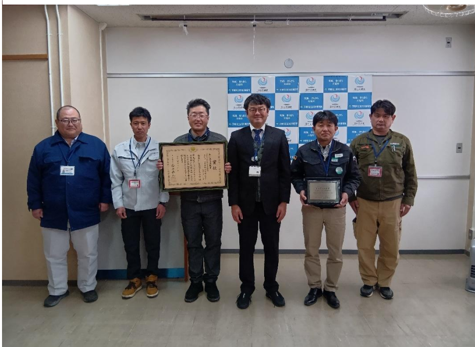
「飯島いいものつくろう会」との記念撮影