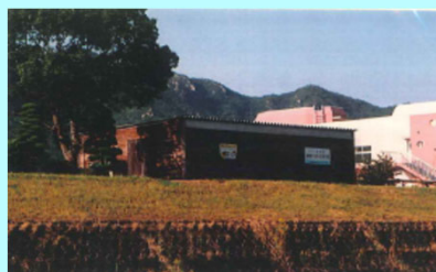
市民団体による活動拠点の整備事例（佐波川）

※ 河川管理者から河川管理施設の維持、除草等の委託を受けることも可能となります。委託先については、公募等の適正な手続きを経て選定を行う予定です。