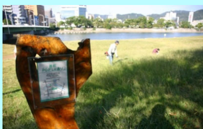
市民団体による看板設置事例（太田川）