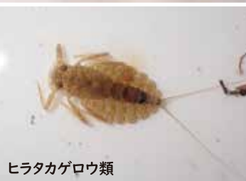
ヒラタカゲロウ類