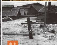
山崩れで土砂が押し寄せた家屋