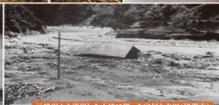
三峰川から流出した土砂に埋った家屋と水田(伊那市)