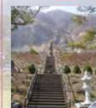
慰霊碑 (大西山の崩壊で殉職された建設者職員の慰霊碑)