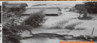
高森町田吹の被災状況