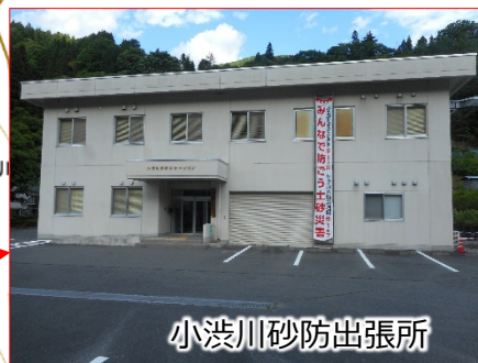
小渋川砂防出張所