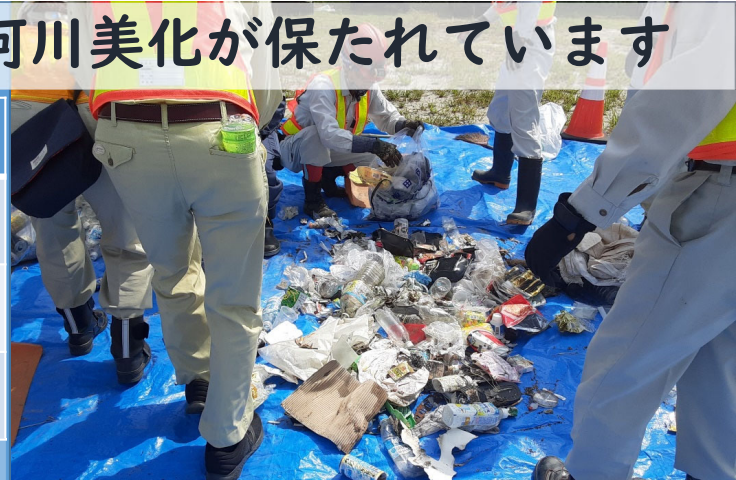
令和3年度 河川美化活動の実施結果と参加人数