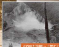
大西山が崩壊し、土砂が土がった瞬間(大鹿村)