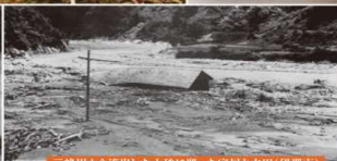
三峰川から流出した土砂に埋った家屋と水田(伊那市)