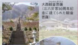
慰霊碑 (大西山の崩壊で殉職された建設者職員の慰霊碑)