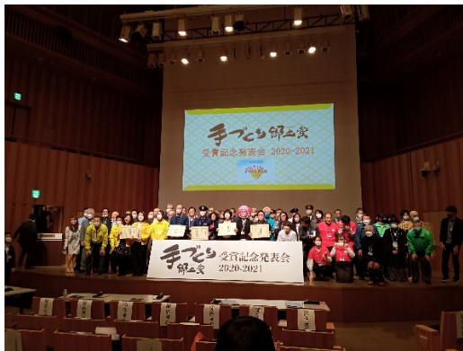
発表者全員で記念撮影