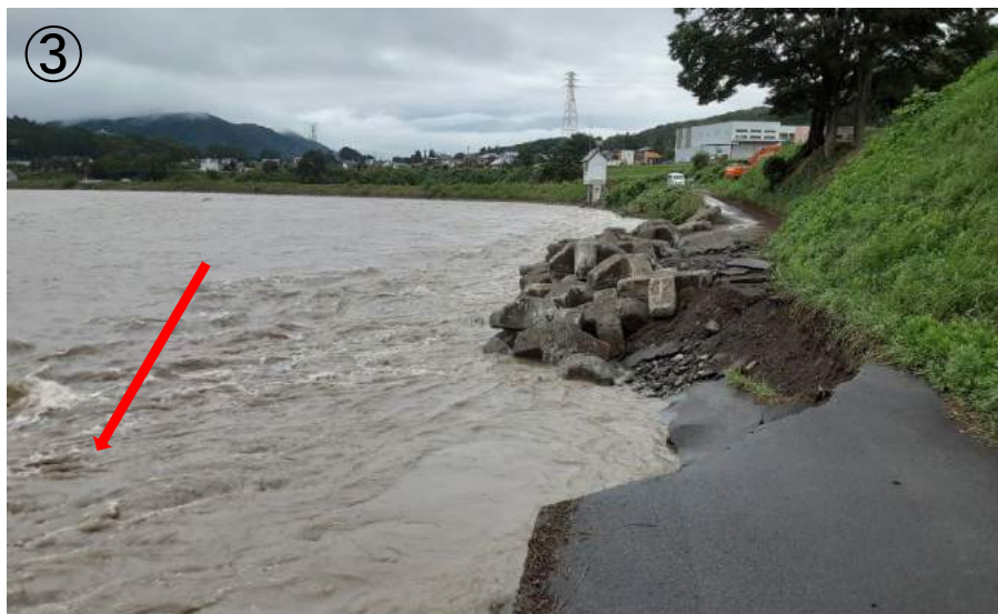
↑ 令和3年8月16日時6時点