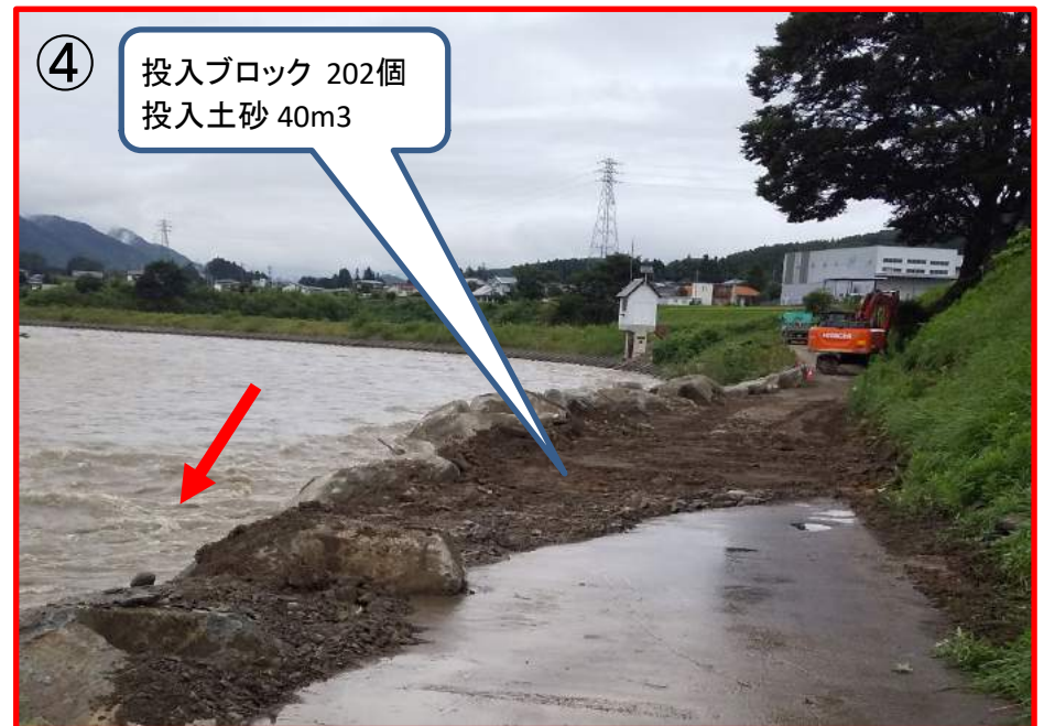
↑ 令和3年8月16日17時時点