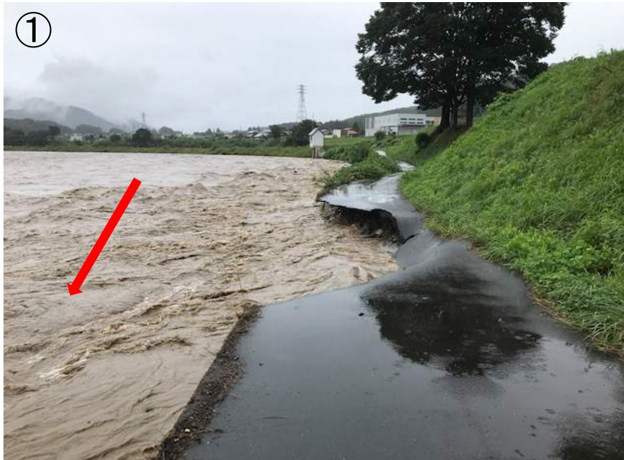
↑ 令和3年8月15日10時時点