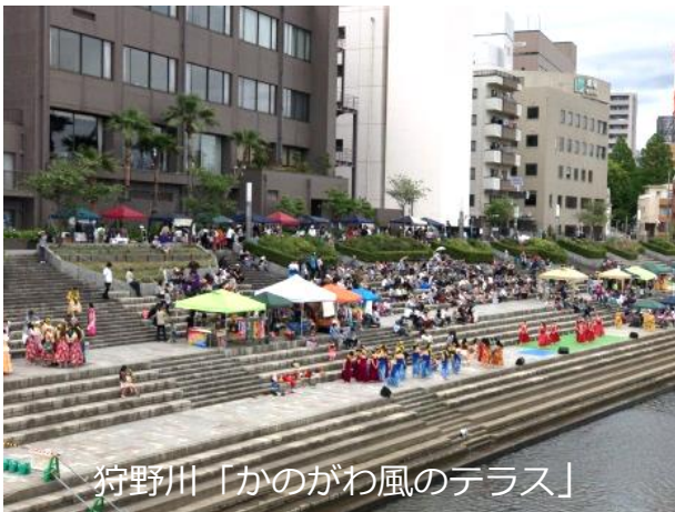
狩野川「かのがわ風のテラス」