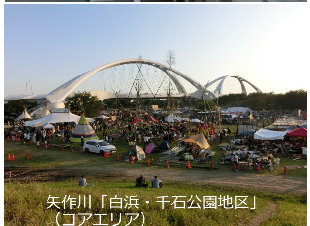
矢作川「白浜・千石公園地区」 (コアエリア)