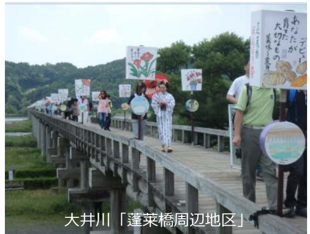
大井川「蓬萊橋周辺地区」