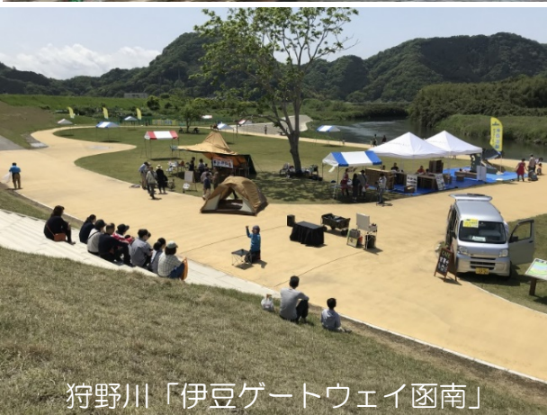
狩野川「伊豆ゲートウェイ函南」