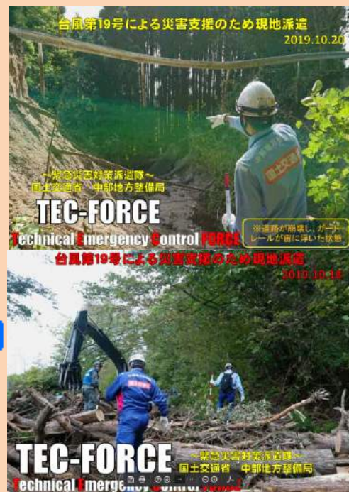
土砂崩落による町道被災 (山田町船越地区)