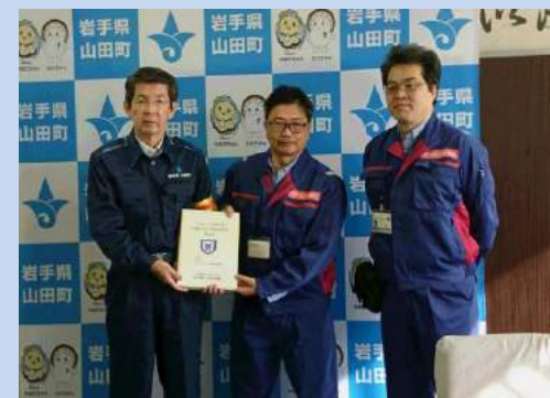
道路調査班⑤と合同で手交