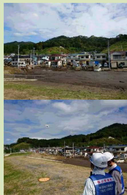
山田町田の浜地区