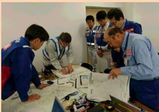
調査箇所、作業工程の確認