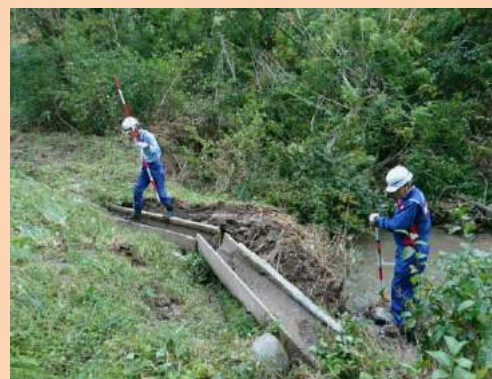
河川増水による水路流失